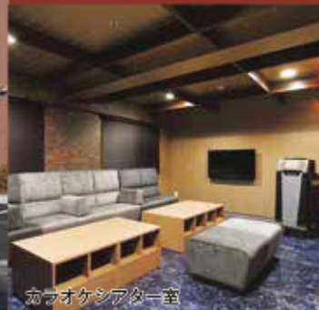
ラウンジ・アター室

〒065-0020 北海道札幌市東区北20条東1丁目4番1号 TEL:011-731-1294 FAX:011-722-1295