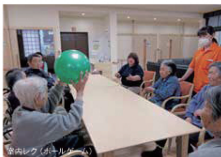
室内レク(ボールゲーム)