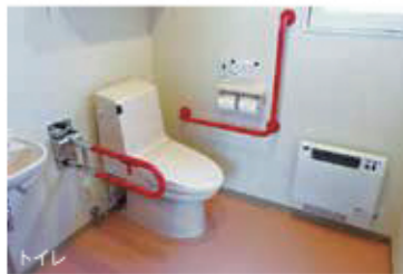
入浴・トイレは個別に支援致します。