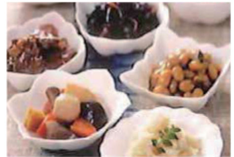
栄養バランスの取れたお食事をご提供しています。