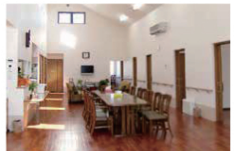
多目的スペース～食堂