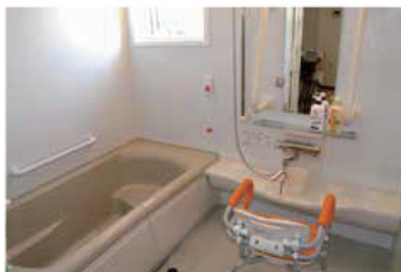
ユニットバスもご用意。