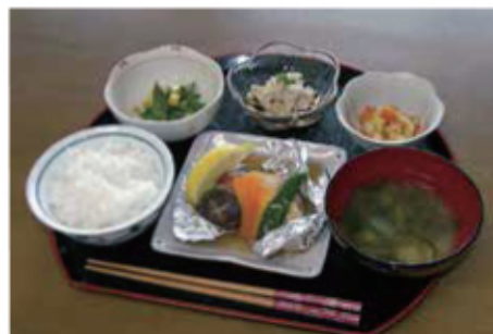
栄養バランスの取れたお食事をご提供しています。