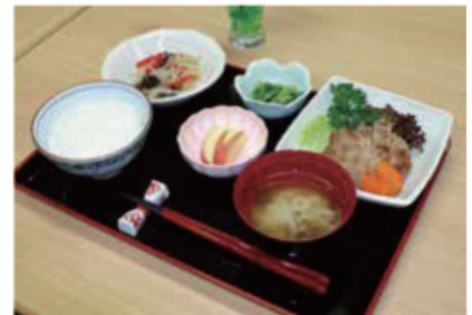
栄養バランスの取れたお食事をご提供しています。