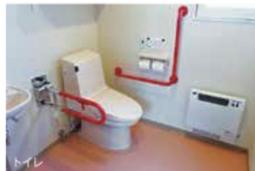
入浴・トイレは個別に支援致します。