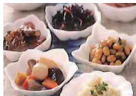
栄養バランスの取れたお食事をご提供しています。