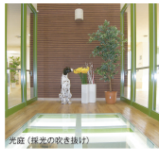
光庭 (採光の吹き抜け)